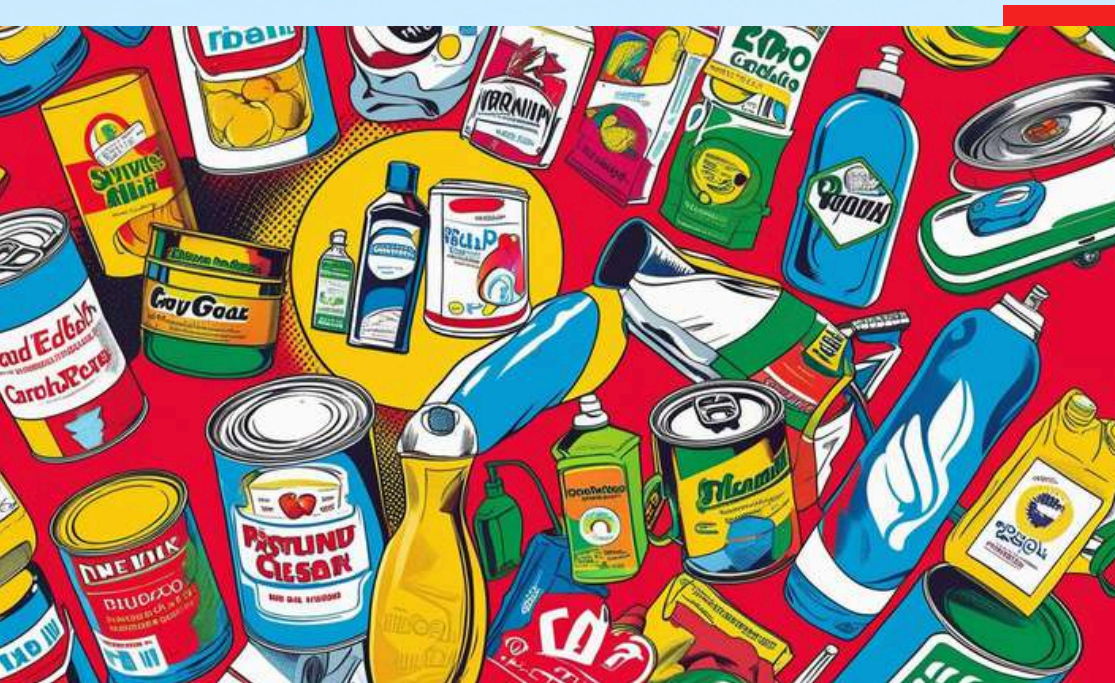
Imagen creada con IA, inspirada en el Art Pop de Andy Warhol