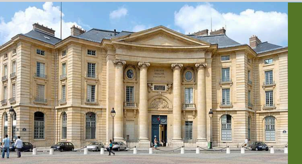
Antigua Facultad de Derecho y Economía de la Universidad de París, fundada en el año 1150.

En tercer lugar, el saber adquiere un nuevo estatuto en la " Universitas ". En efecto, el saber es siempre saber de "alguien" y sobre "algo", trátase de competencias físicas, médicas, matemáticas o filosóficas. La Universitas incluía originalmente la recepción de los saberes en cuestión desde un horizonte de "apertura". Esto implica reconocimiento, intercambio y aprendizaje mutuo de los diversos saberes. Por eso las facultades no constituían el todo, sino la parte: la facultas (facultad) es parte del todo que es la Universitas . El vocablo actual para designar este aspecto de mutua relación corresponde al acarreado término de "interdisciplinariedad".