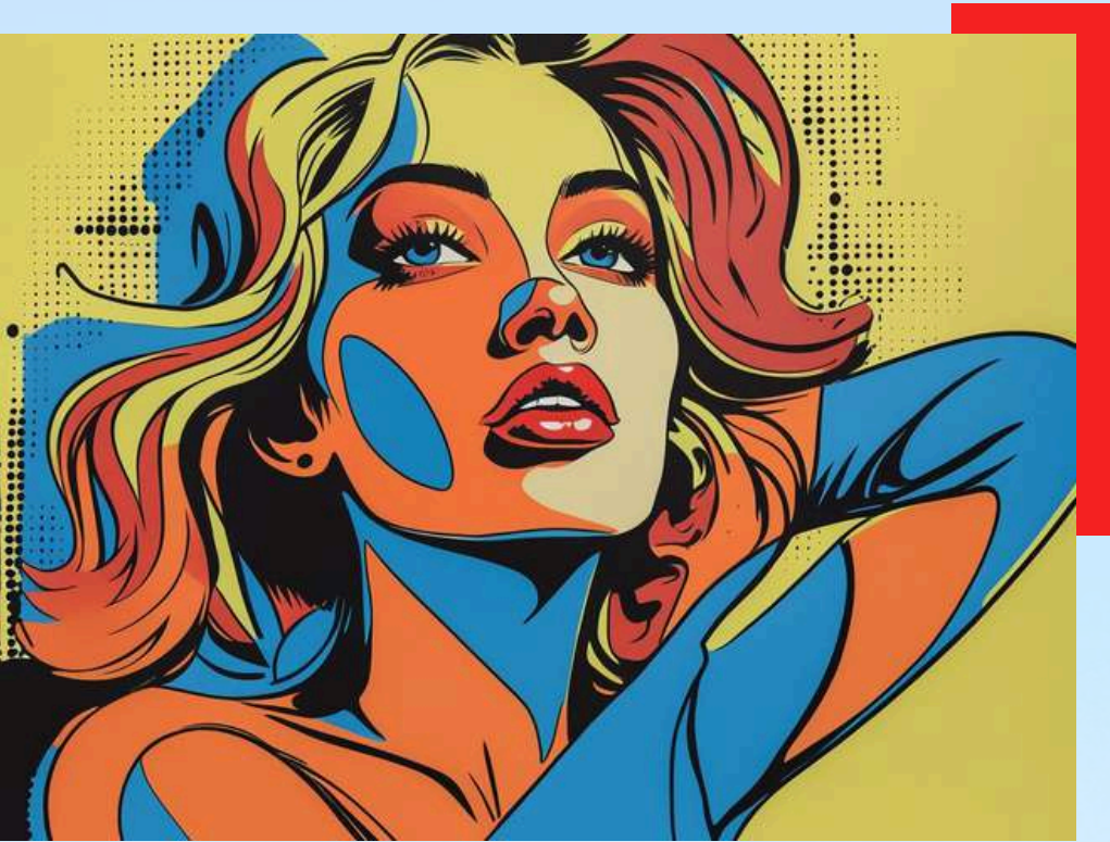
Imagen creada con IA, inspirada en el Art Pop de Andy Warhol

Rápidamente Warhol se convirtió en una celebridad. De pronto, el expresionismo abstracto pareció dejar de existir, o de importar, ahora lo moderno era el pop, con su frescura, humor y superficialidad. Estuvo tan interesado en que su nombre apareciera siempre en la prensa, que para ello incluso contrató publicistas. Su imagen pública desde los inicios de su carrera fue el pilar fundamental de su éxito comercial.