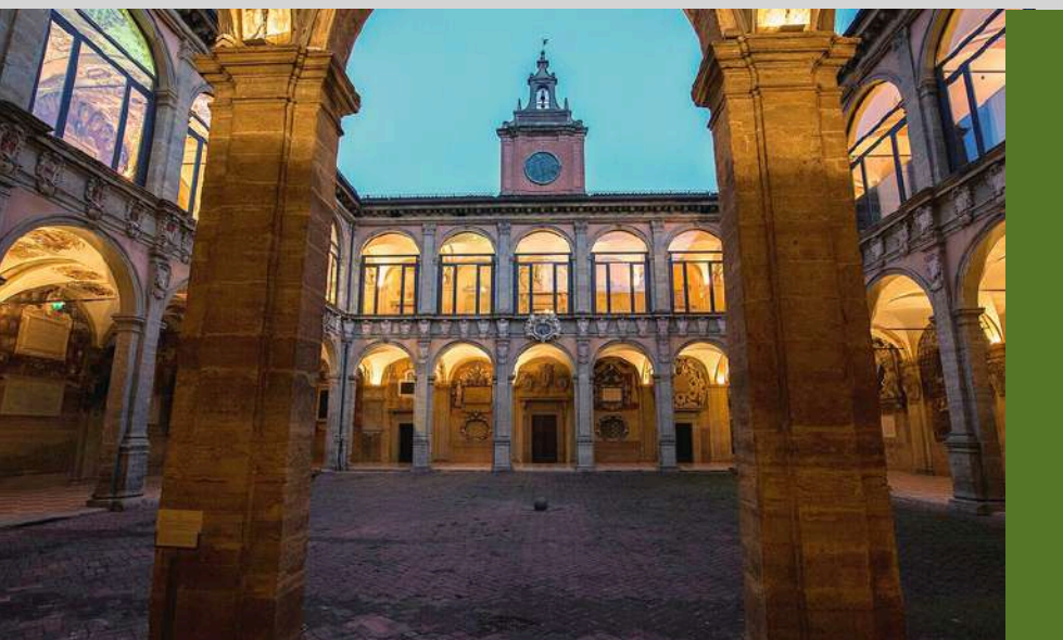
Universidad de Bolonia, fundada en 1088. Considerada la más antigua del mundo occidental.

El origen de las Universidades lo podemos identificar en la iniciativa de los papas y monarcas europeos de los siglos XII y XIII por crear un espacio "libre, autónomo y fértil" para el desarrollo de los saberes. Las primeras Universidades constituyeron esos espacios, sean aquellas de creación pontificia o real, como la de Bolonia, París, Oxford, Salamanca y Nápoles, por mencionar algunas. Pronto, papas y monarcas compitieron en fundar y promover nuevas universidades, de tal modo que a fines del s. XVI su número se había extendido a más de sesenta. Para su buen funcionamiento las Universidades fueron dotadas de privilegios y regalías que garantizaron el pago de los profesores, el mantenimiento de las instalaciones y la regularidad de los cursos.