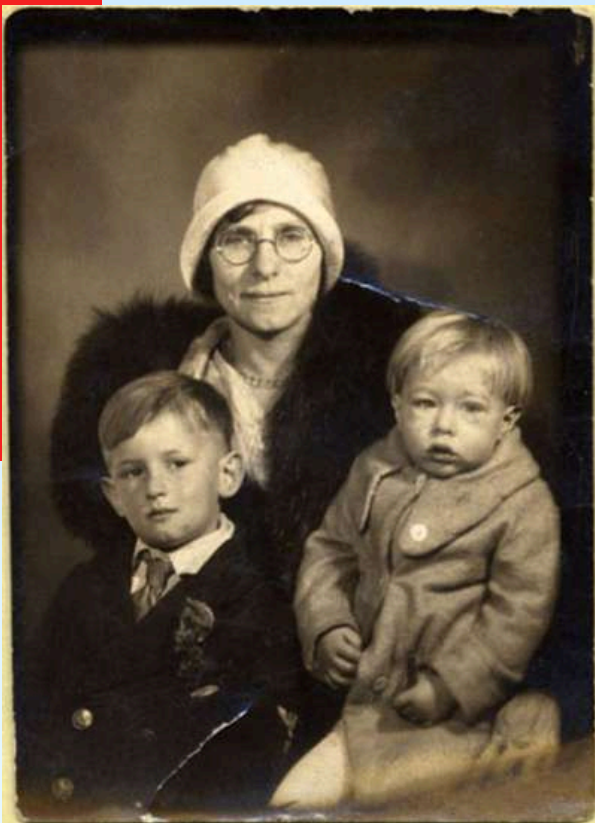
Warhol de niño (derecha) con su madre, Julia, y su hermano, John, en 1930.

Andy Warhol nació un 6 de agosto de 1928 en Nueva York, Estados Unidos. Y desde pequeño quiso ser famoso. Andy, hijo de padres eslovacos, pasó gran parte de su infancia enfermo de corea de Sydenham, trastorno que provoca movimientos incontrolables de las extremidades y desórdenes en la pigmentación de la piel, lo que lo hizo hipocondriaco y temeroso de los médicos. Aislado en su cama, comenzó a dibujar, escuchar radio y coleccionar imágenes de estrellas de cine. Esta etapa marcaría de forma decisiva su personalidad para el resto de su vida.