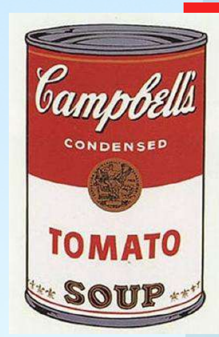
Campbell's Soup I (1968). Imagen por: https://en.wikipedia.org/w